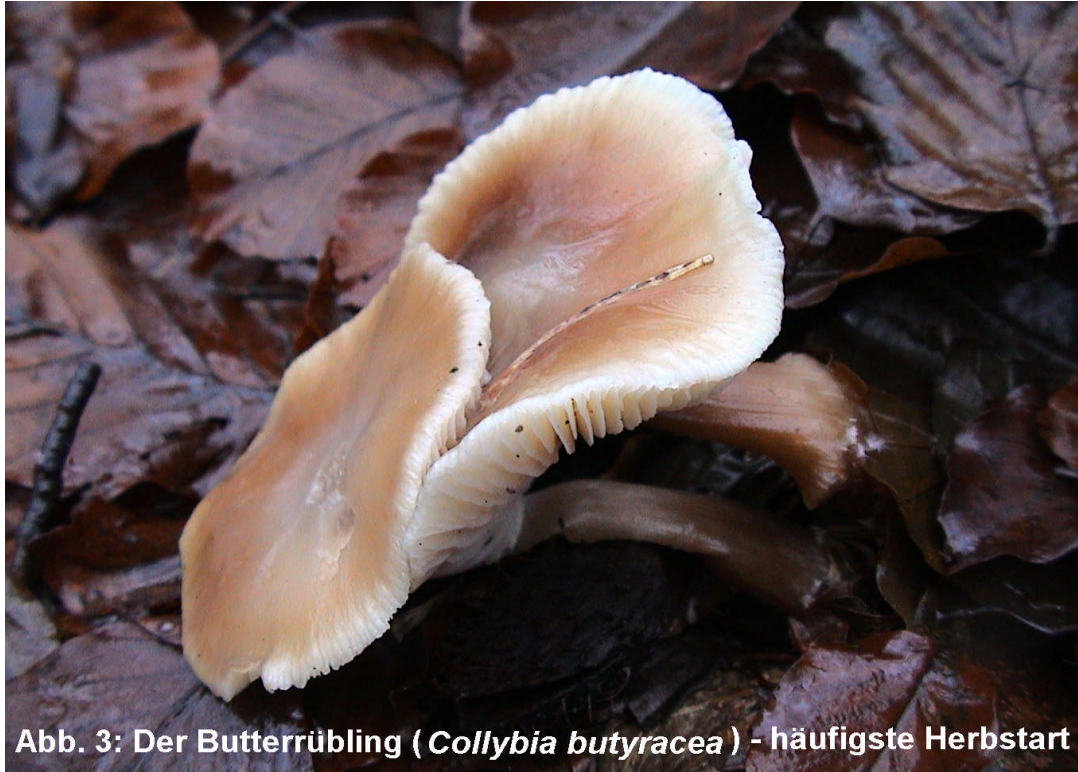
Abb. 3: Der Butterrübling ( Collybia butyracea ) - häufigste Herbstart

Um zu überprüfen, ob die Fruchtkörpererhebungen tatsächlich die Entwicklungen im Waldboden widerspiegeln, sollen sie durch genetische Untersuchungen an Mycelproben des Bodens ergänzt werden.