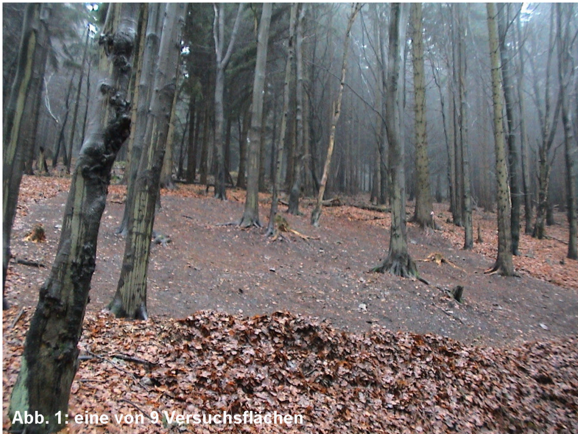
Abb. 1: eine von 9 Versuchsflächen

Die Studie soll zum einen unser Bild über menschliche Einflussnahme auf die Entwicklung des Ökosystems Wald vervollständigen. Zum anderen ist der Eingriff auch im Zusammenhang mit gegenwärtig praktizierten Managementmethoden zur Aushagerung von eutrophierten Wäldern zu sehen.