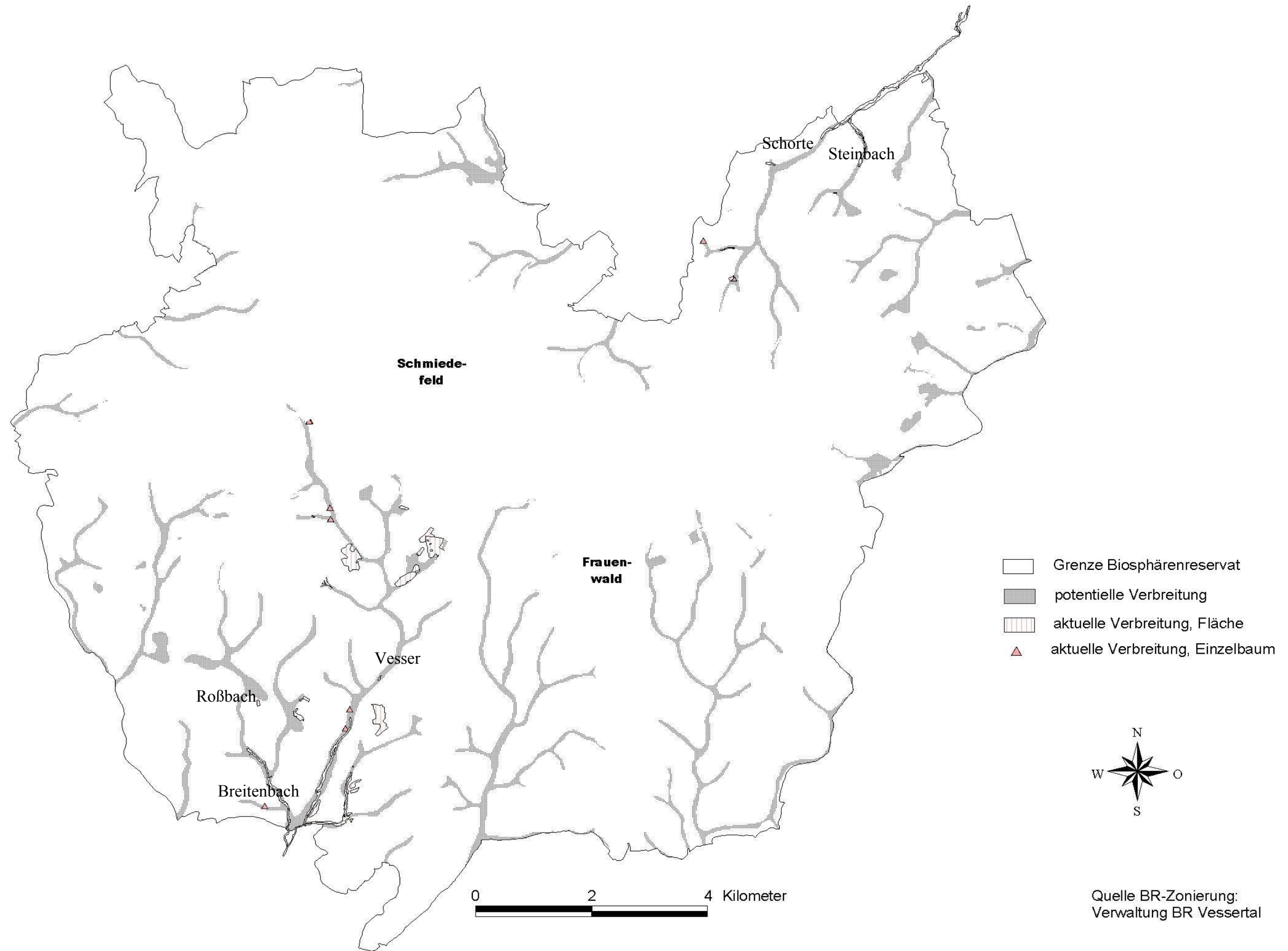
Karte 2: Aktuelle und potentielle Verbreitung der Schwarzerle ( Alnus glutinosa ) im Biosphärenreservat Vessertal