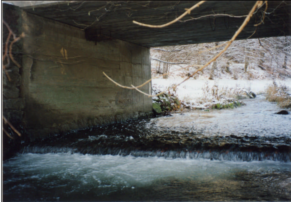
Abbildung 1: Sohlabsturz an der Schneidmühlsbrücke

relativ langer durchgehender Fließgewässerabschnitt geschaffen werden könnte. Auch der Umbau des Wehrs an der Forellenzucht Pfeuffer in eine raue Sohlgleite mit Stauhaltung zur Ausleitung von Wasser für die Forellenteiche wäre eine solche Maßnahme.