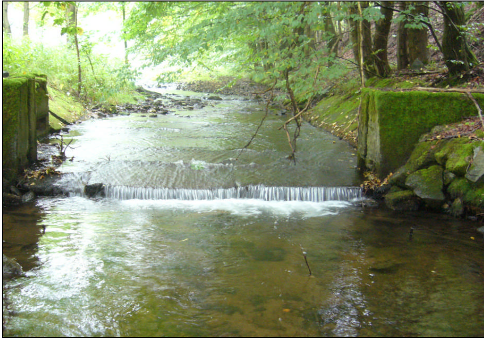
Abbildung 2: Zustand des alten Stauwehrs