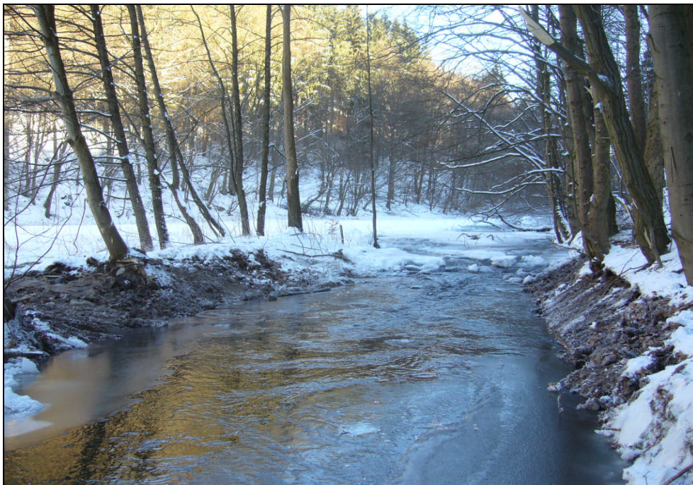
Abbildung 3: Zustand nach Abriss des alten Stauwehrs